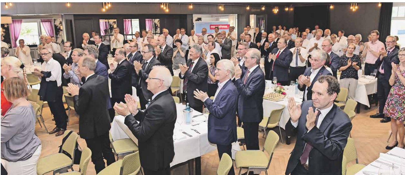
Die Gäste des Empfangs verabschieden Präsident Voss a.D. mit stehenden Ovationen.