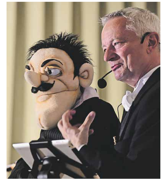
Bauchredner „Master me“ führte charmant durch den abendlichen Empfang.