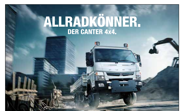
FUSO - Eine Marke im Daimler-Konzern

Der Spezialist für's Grobe. Der Canter 4x4 scheut sich nicht davor, seine Reifen schmutzig zu machen. Und das, dank des zuschaltbaren Allradantriebs, auf jedem Terrain. Und bei allem Tatendrang ist er zudem auch noch sehr sparsam unterwegs. Jetzt informieren bei Ihrem FUSO Partner Osnatruck Nutzfahrzeugservice GmbH.